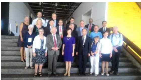
華瑜教授（前排左三）獲選為下屆 IUPS 主席，與 IUPS 的理監事及幕僚合影。